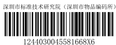
图A.6 同时标注名称与统一社会信用代码的一维条码展示