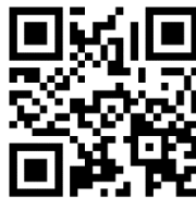
图A.5 统一社会信用代码的二维条码展示